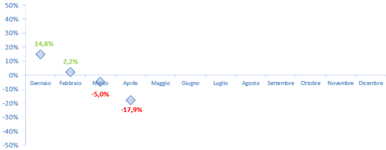
Figura 10 Var. % 2020/2019 - Carri totali (arrivi+partenze)