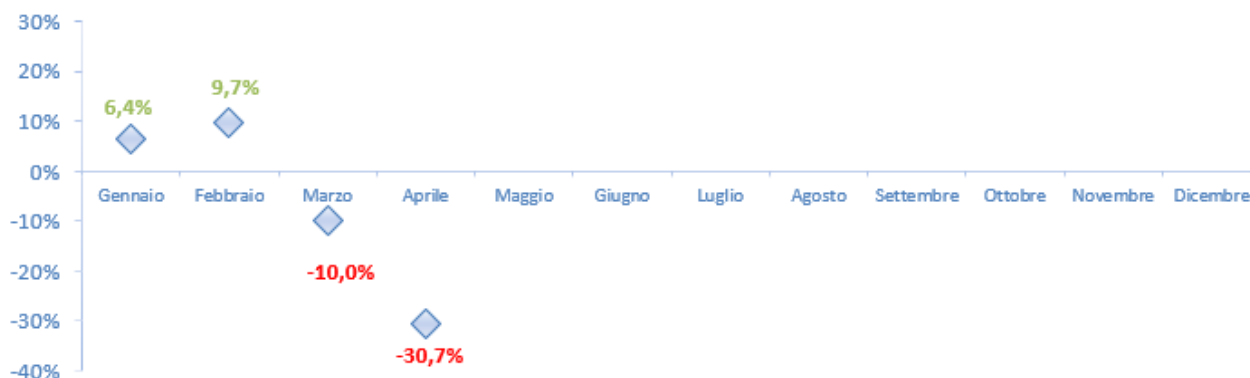
Figura 3 Var. % 2020/2019 - Camion totali (arrivi+partenze)

La suddivisione per fascia oraria evidenzia una concentrazione delle entrate tra le 12:00 e le 18:00 con 20.248 transiti (corrispondenti al 41% delle entrate totali).