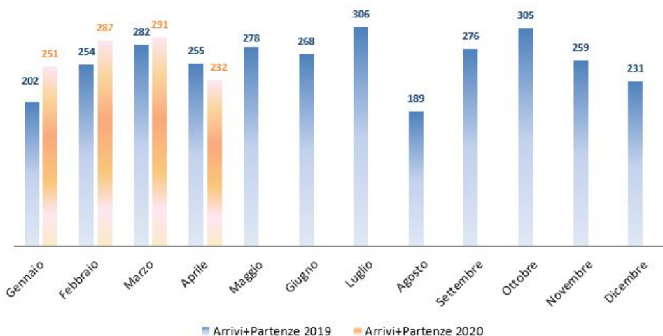
Figura 6 Treni in arrivo e partenza dall'Interporto nel biennio 2020/2019