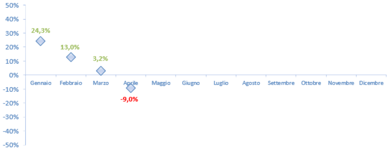
Figura 7 Var. % 2020/2019 - Treni totali (arrivi+partenze)