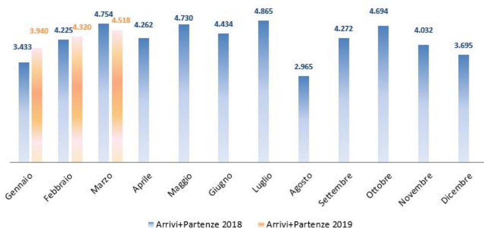
Figura 9 Carri in arrivo e partenza dall'Interporto nel biennio 2020/2019