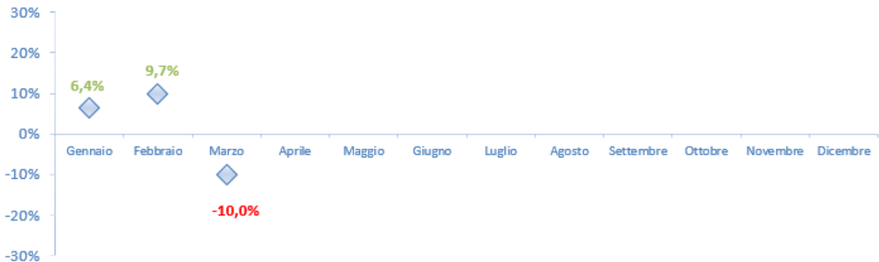
Figura 3 Var. % 2020/2019 - Camion totali (arrivi+partenze)

La suddivisione per fascia oraria evidenzia una concentrazione delle entrate tra le 12:00 e le 18:00 con 26.540 transiti (corrispondenti al 40% delle entrate totali).