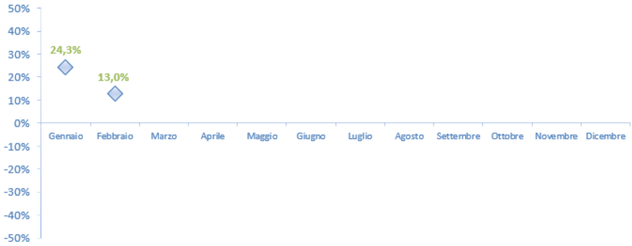
Figura 7 Var. % 2020/2019 - Treni totali (arrivi+partenze)