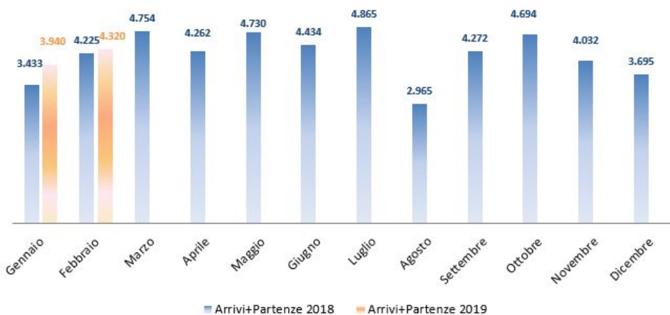
Figura 9 Carri in arrivo e partenza dall'Interporto nel biennio 2020/2019