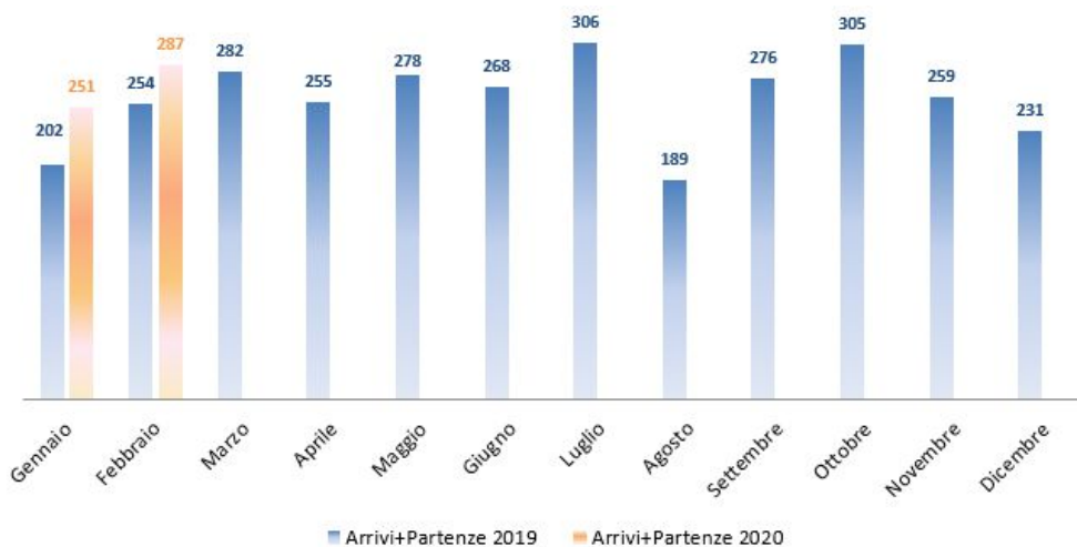
Figura 6 Treni in arrivo e partenza dall'Interporto nel biennio 2020/2019